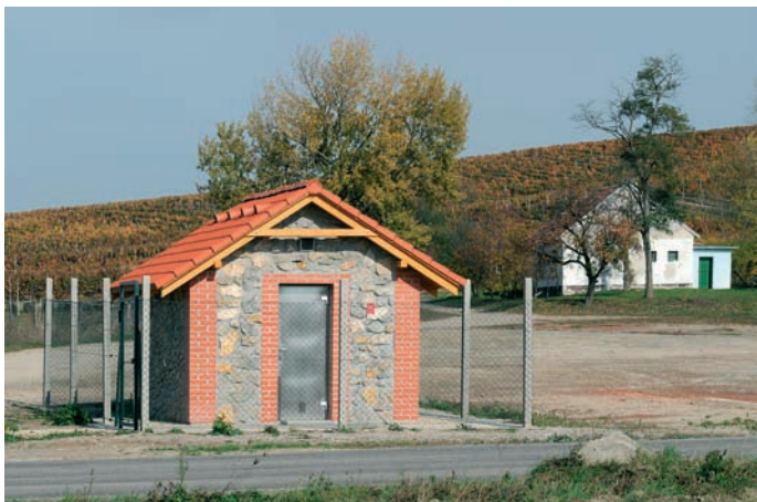
Obr. 10: Čerpací stanice Novosedly

Nový vodojem Březí (objem 2 × 300 m 3 ) byl postaven v místě původního vodojemu (objem 250 m 3 ) (obr. 9 a 11). VDJ Březí v současnosti slouží jako zásobovací vodojem pro obce Březí, Dobré Pole a pro novou ČS Novosedly. Tato spotřebiště jsou zásobována vodou gravitačně. Na VDJ Březí je již připravena i čerpací stanice (VDL 2.60/7-2) pro výhledové čerpání vody do řídicího VDJ Dolní Dunajovice skupinového vodovodu Dolní Dunajovice. Kapacita čerpací stanice je 13 l/s. Čerpadla jsou zapínána a vypínána v závislosti na hladině ve VDJ Dolní Dunajovice. Na odbočce z výtaku do VDJ Dolní Dunajovice je osazen automatický hydraulický regulační ventil s předřazeným filtrem, který plní funkci pojišťovacího ventilu a případné vodní rázy přepouští do sacího potrubí před čerpadla. Současně je na odbočce ze sacího potrubí osazen automatický regulační ventil ve funkci hydraulické zpětné klapky, který přepouští případné vodní rázy v sacím potrubí do výtlačného potrubí za čerpadly. Na vodojemu Březí se také v případě potřeby provádí do-