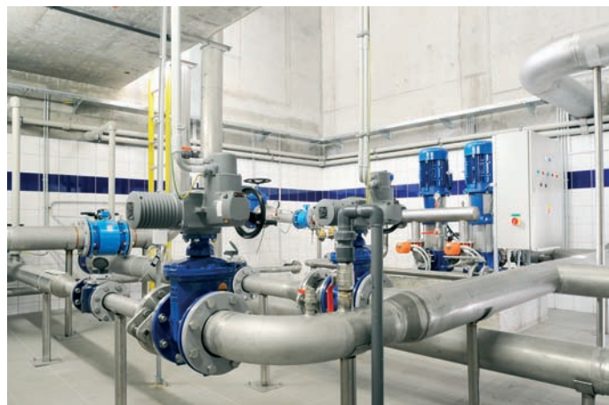
Obr. 11: Vodojem Březí, technologie

chlórování vody dávkováním plynného chlóru. V chlórovně je nainstalován podtlakový dávkovací systém plynného chlóru Wallace & Tiernan Depolox BASIC.