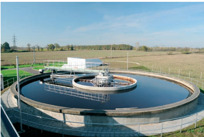
Obr. 5: Úpravna vody v Lednici – klariflokulátor

Součástí části D projektu „Břeclavsko – rekonstrukce a výstavba vodohospodářské infrastruktury v povodí řeky Dyje“ je i propojení skupinového vodovodu (SV) Novosedly a SV Dolní Dunajovice se SV Mikulov – Lednice. Propojení těchto skupinových vodovodů umožnilo přivedení kvalitní vody z ÚV Lednice do oblastí, kde mají místní zdroje vody vysoký obsah dusičnanů a síranů.