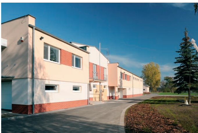
Obr. 3: Úprava vody v Lednici – provozní budova

Ve strojovně jsou osazena dvě čerpadla (Vogel, typ LMN 50-250 U1NN, výkon jednoho čerpadla je až 22 l/s, výkon čerpadla je možno plynule regulovat) pro čerpání směrem na Lednici. Jedno čerpadlo je