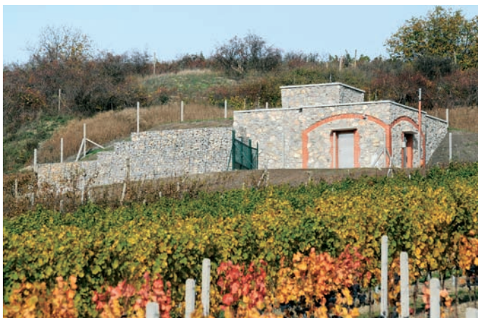
Obr. 9: Vodojem Březí

kteřý přepouští případné vodní rázy v sacím potrubí do výtlačného potrubí za čerpadly. Obdobně je řešena protirázová ochrana i u výtaku do VDJ Březí.