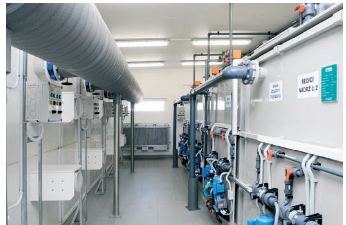
Obr. 4: Úprava vody v Lednici – aerační věže

v rozmezí 970 až 1 300 m 3 /h) s protihlukovým krytem. Při regeneraci filtrů pouze vzduchem jsou v provozu obě dmychadla, při následném praní vodou a vzduchem pracuje jen jedno dmychadlo.