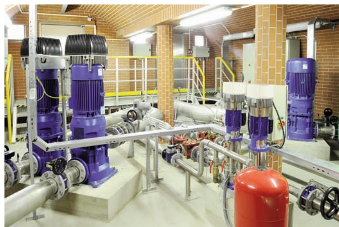
Obr. 8: Čerpací stanice Mušlov, technologie

4 l/s. Čerpané množství je automaticky regulováno frekvenčními měniči podle tlaku na výtaku (podle okamžité spotřeby ve spotřebišti). Hygienické zabezpečení vody dodávané do Mušlova je zajištěno dávkováním 15% roztoku chlornanu sodného (NaClO) v závislosti na průtoku. Na sání čerpadel (to je na přítoku do ČS Mušlov z VDJ Sedlec) je osazena tlaková nádoba s vakem jako protirázová ochrana potrubí. Na odbočce z výtaku do VDJ Mikulov-Bezručova je osazen automatický hydraulický regulační ventil (CLA-VAL) s předřazeným filtrem, který plní funkci pojistovacího ventilu a případné vodní rázy přepouští do sacího potrubí před čerpadla. Současně je na odbočce ze sacího potrubí osazen automatický regulační ventil ve funkci hydraulické zpětné klapy,