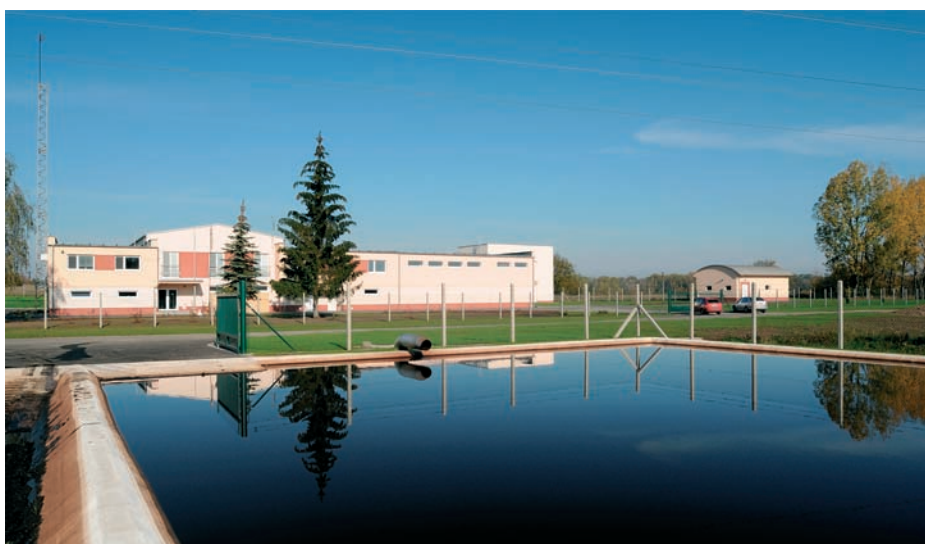
Obr. 1: Úpravna vody v Lednici – celkový pohled od kalových polí

Předčištěná voda z klariflokulátoru je vedena přes rozdělovací objekt na pět otevřených pískových filtrů. Každý filtr má plochu 18,5 m 2 .